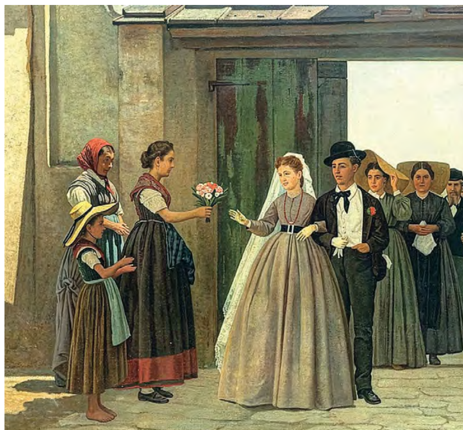
Silvestro Lega, Gli Sposi Novelli, 1869

Superata la fase “occulta” con argomenti sempre concreti (“persuasi li genitori della convenienza e utilità di tale maritaggio”; anche questa una casistica non proprio estinta...), era costume che in Romagna “li giovani contadini, prima di ammogliarsi, amoreggino li tre, quattro, cinque o sei anni”. Guai però a mollare il fidanzato, giacché in questi casi “nascono disordini e risse sanguinose, venendo