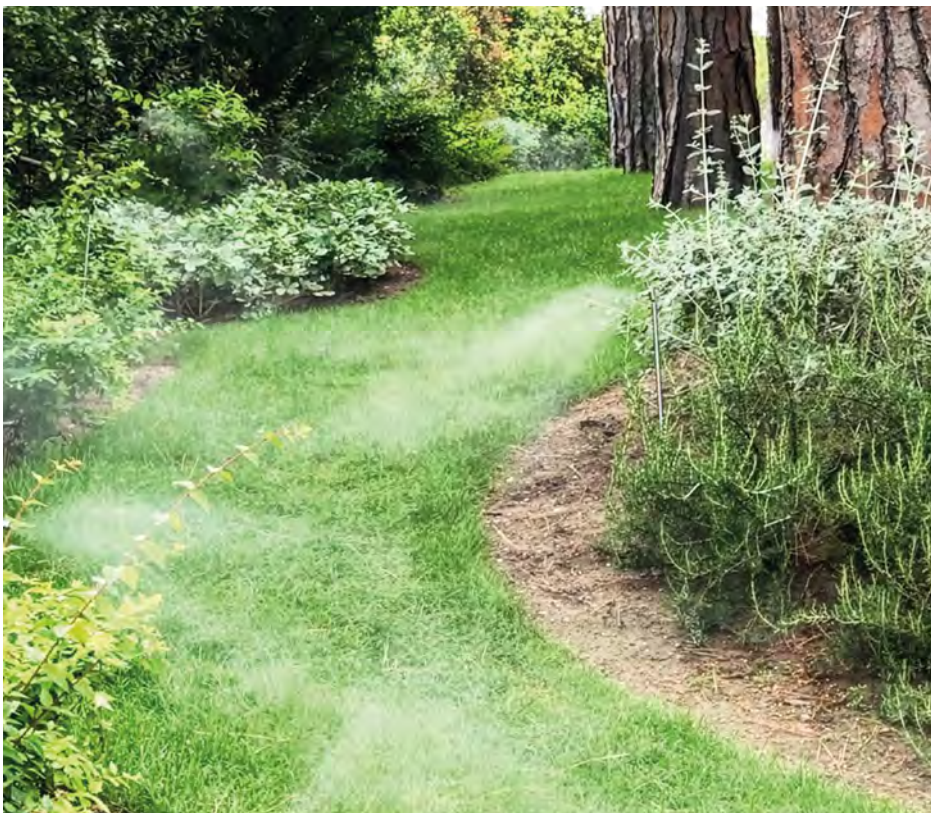
Un impianto di nebulizzazione antinsetto in funzione

I risultati sono incoraggianti: “Abbiamo iniziato a proporre questi impianti da circa due anni - conclude Drei -. I clienti che li hanno installati sono molto soddisfatti e le richieste stanno aumentando: è una soluzione che consente di gestire il problema delle zanzare in modo continuativo e con un intervento minimo”. (m.g.)