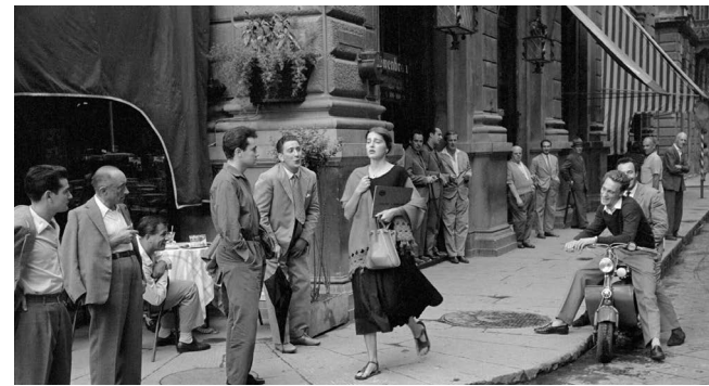
American Girl in Italy di Ruth Orkin