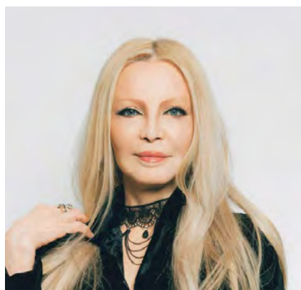
Patty Pravo, lunedì 20 a Bologna