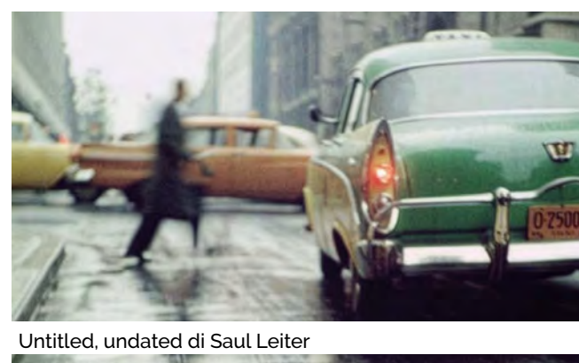
Untitled, undated di Saul Leiter