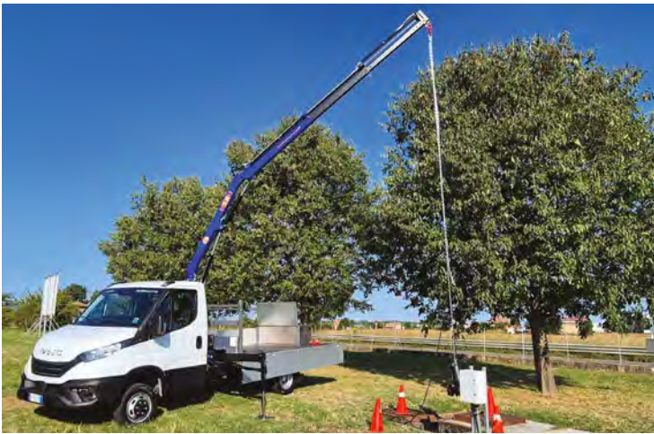
Un nuovo camion gru di Luxco

"Il nostro percorso conferma la volontà di consolidare quanto costruito negli anni - conclude Santi -, cercando sempre di intercettare opportunità di sviluppo future". (I.R.)