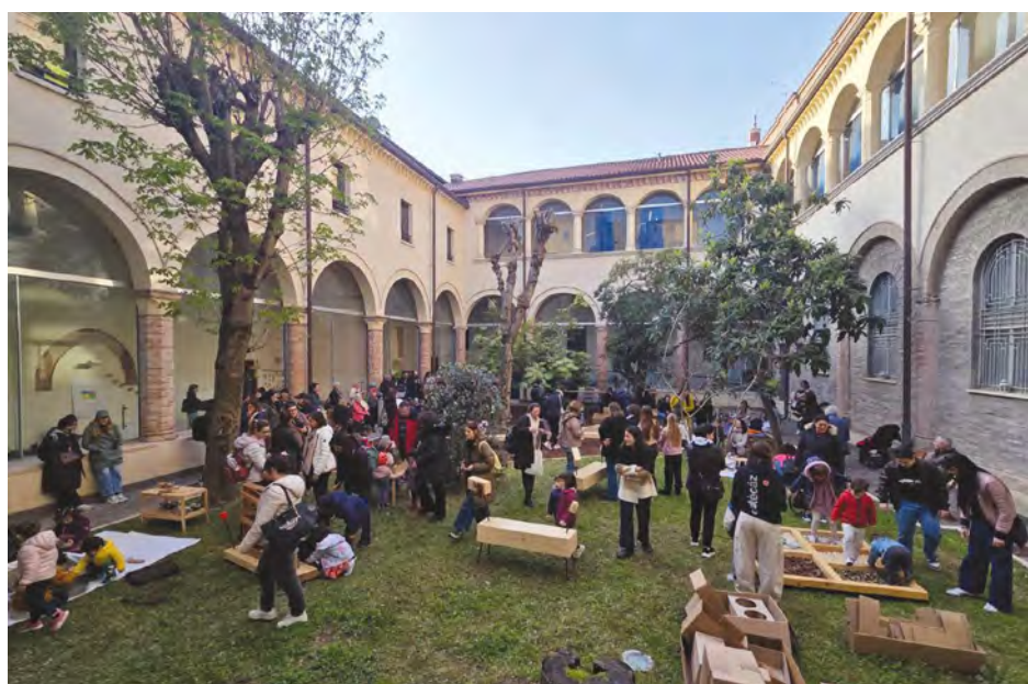
Il Chiostro del Centro per le Famiglie inaugurato a fine marzo dalla cooperativa