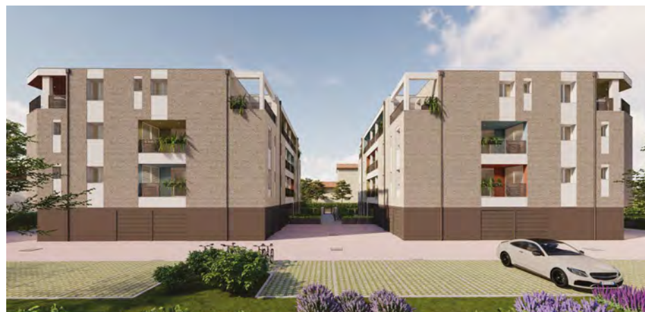
L'anteprima dell'intervento che Coabi realizzerà a Faenza (via Piero della Francesca)