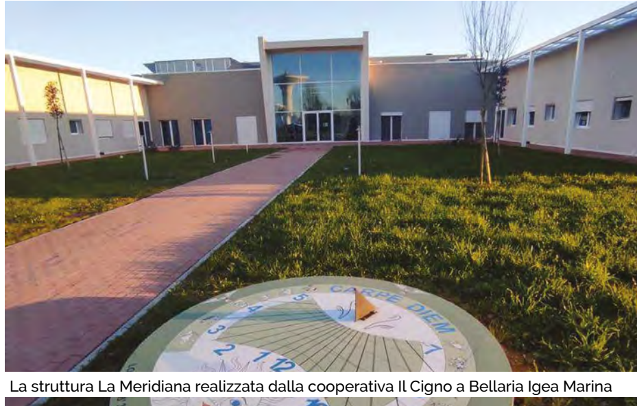
La struttura La Meridiana realizzata dalla cooperativa Il Cigno a Bellaria Igea Marina