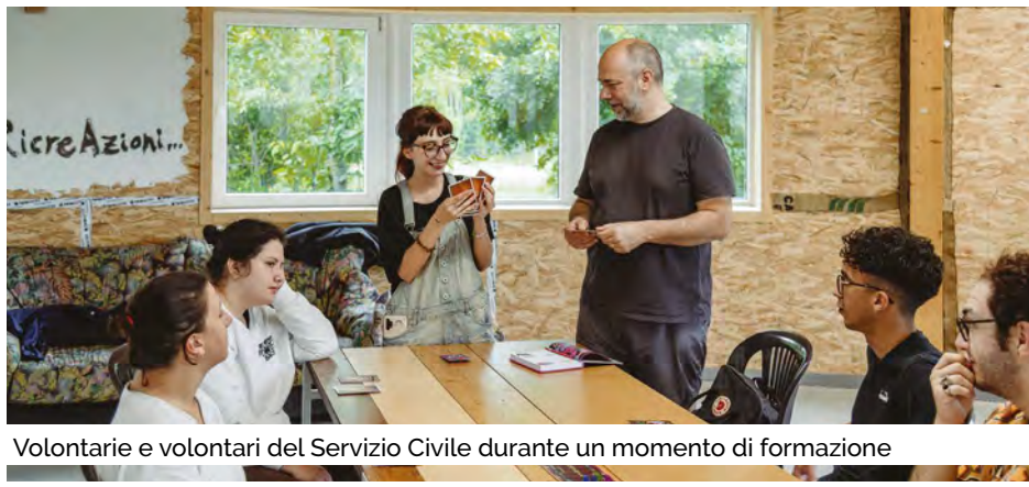
Volontarie e volontari del Servizio Civile durante un momento di formazione