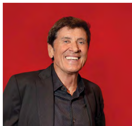
Gianni Morandi, venerdì 24 a Bologna