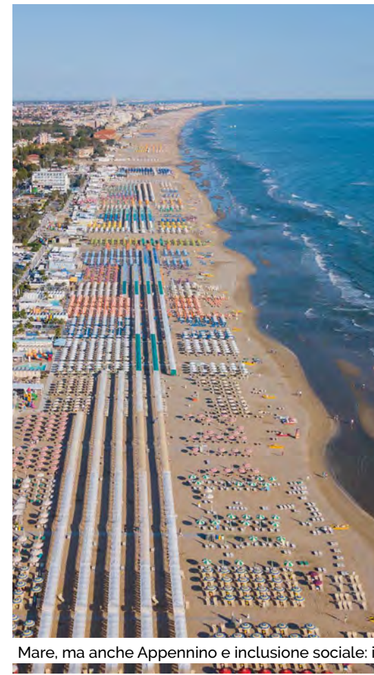
Mare, ma anche Appennino e inclusione sociale: il

"I primi mesi confermano che il territorio ha un'attrattività solida. Le fiere sono andate molto bene, così come la collina. Voglio essere ottimista, ma non possiamo ignorare ciò che sta succedendo