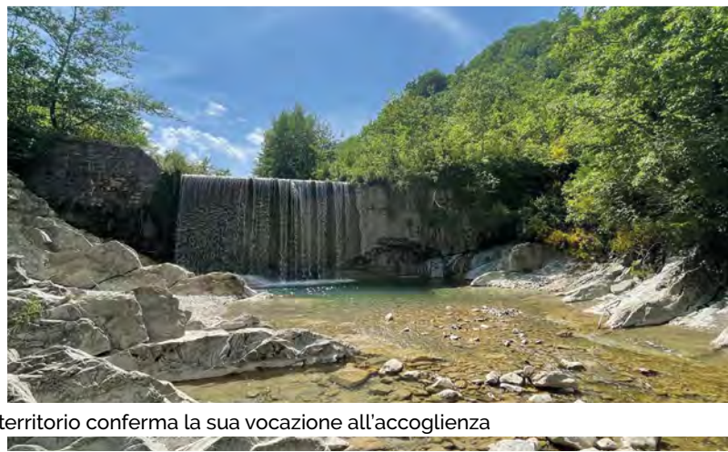
territorio conferma la sua vocazione all'accoglienza