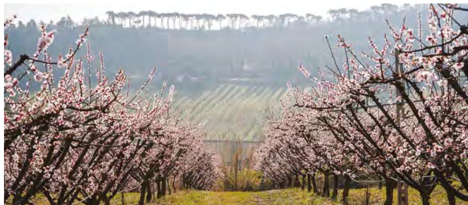
Albicocchi in fiore nella campagna faentina