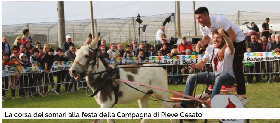
La corsa dei somari alla festa della Campagna di Pieve Cesato